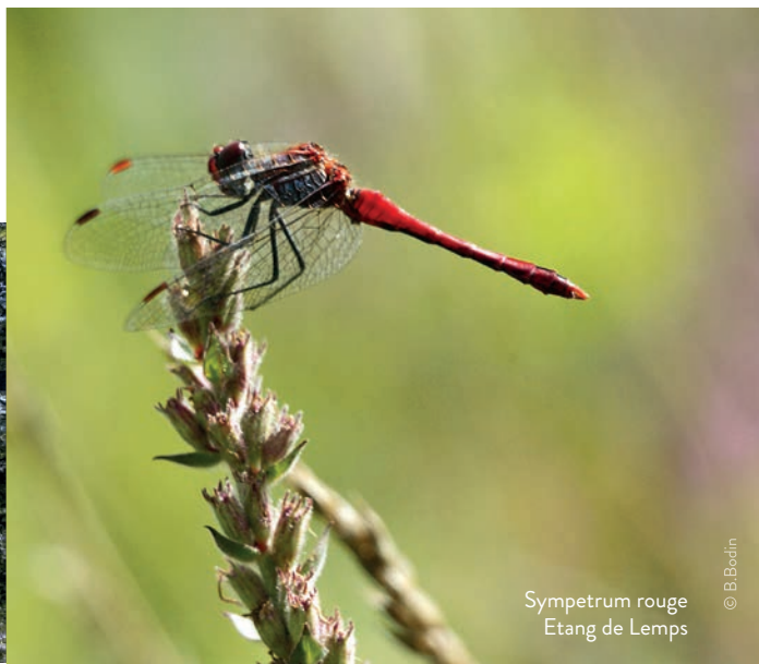
Sympetrum rouge Etang de Lempis