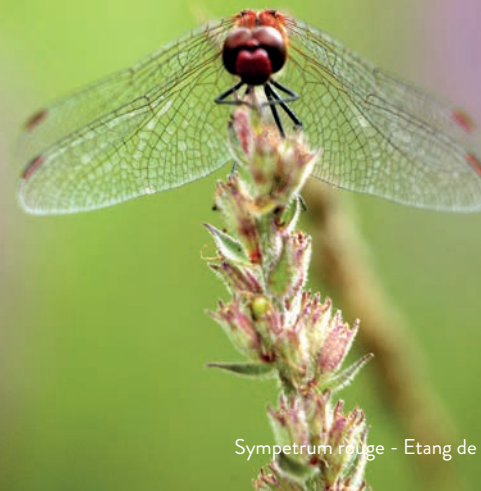
Sympetrum rouge - Étang de Lempis