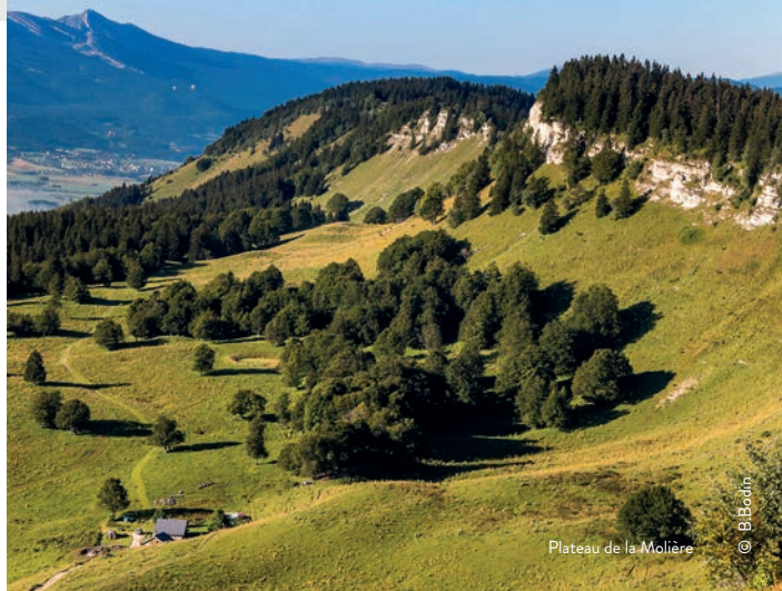
Plateau de la Molière

Profitez de cette balade en montagne pour mieux connaître la géologie du site.