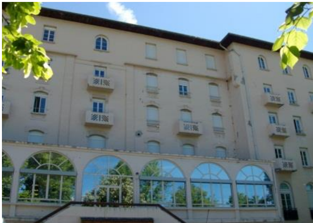
CRET 36, avenue de la République 05100 BRIANCON