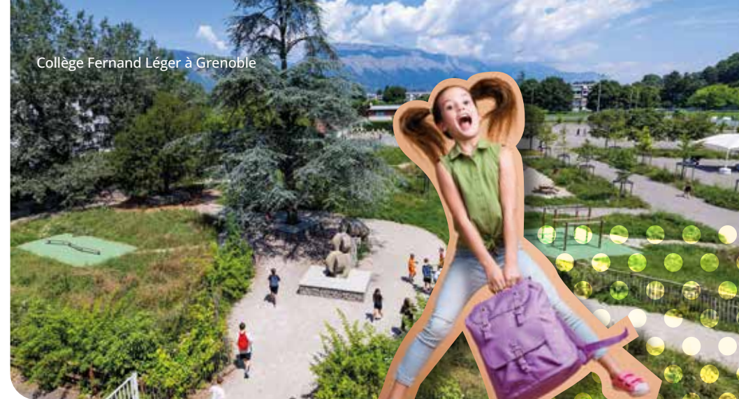
Collège Fernand Léger à Grenoble

Hors temps scolaire, grâce au dispositif 1 clic 1 salle, les salles du collège peuvent être utilisées par des associations locales pour développer la pratique sportive et culturelle.