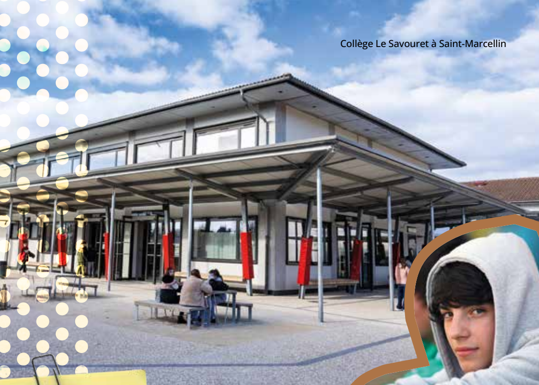
Collège Le Savouret à Saint-Marcellin