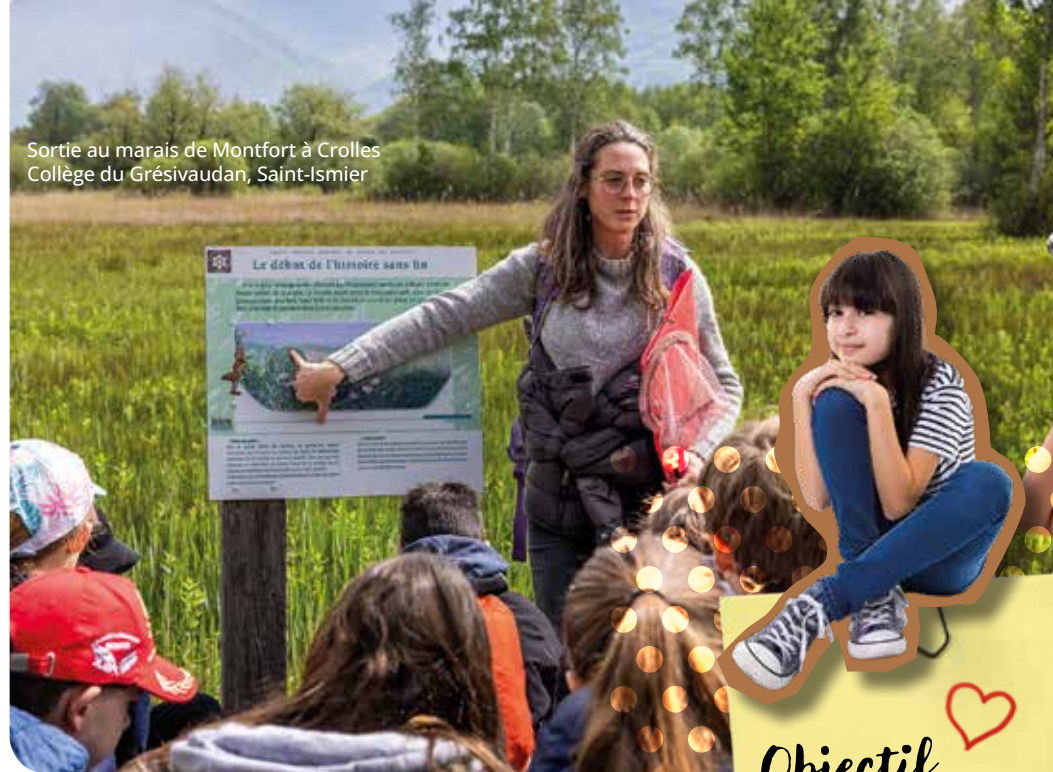
Sortie au marais de Montfort à Crolles Collège du Grésivaudan, Saint-Ismier

des collèges opérationnels en matière de numérique éducatif