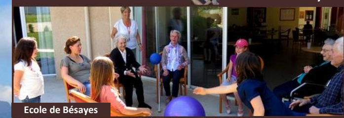
Ecole de Bésayes

L'intergénérationnel , au cœur de notre projet de vie sociale.