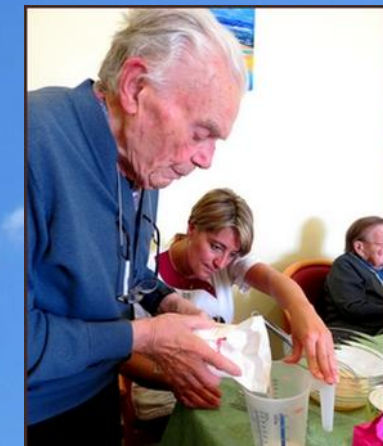
Atelier Pâtisserie - Crêpes le Samedi