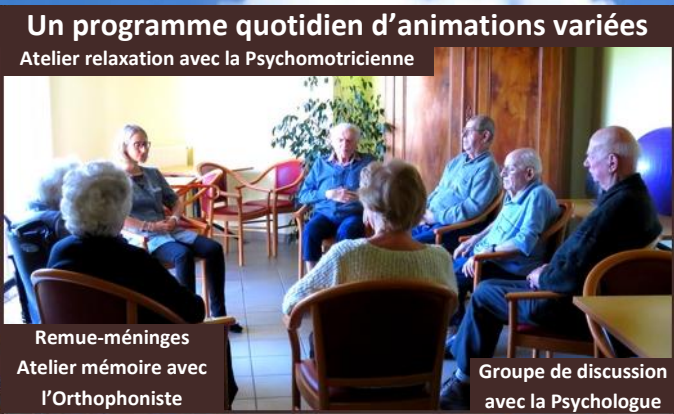
Remue-méninges Atelier mémoire avec l'Orthophoniste