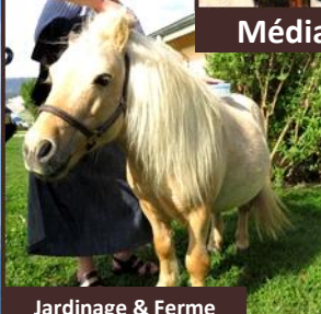
Jardinage & Ferme