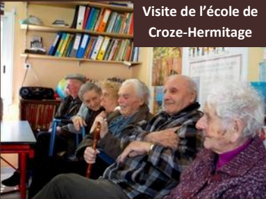
Visite de l'école de Croze-Hermitage