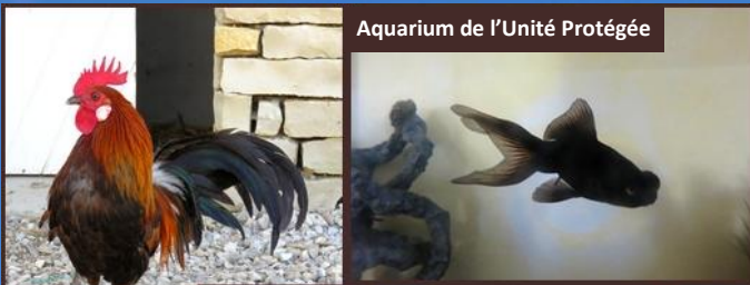
Aquarium de l'Unité Protégée