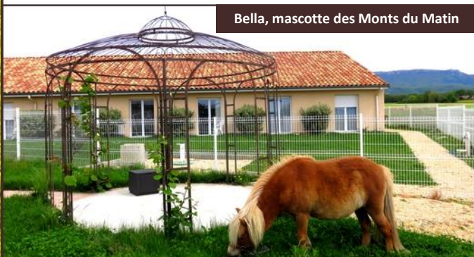
Bella, mascotte des Monts du Matin

Poneys, chiens et chats, poissons, poules et coqs, la médiation animale est une notion importante aux Monts du Matin. Les animaux de compagnie de nos résidents sont également les bienvenues.