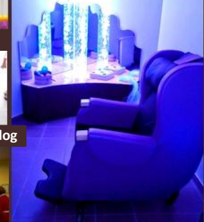
Salle Sensorielle Snoezelen