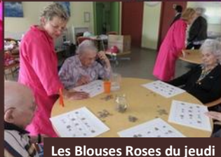
Les Blouses Roses du jeudi

L'intergénérationnel , au cœur de notre projet de vie sociale.