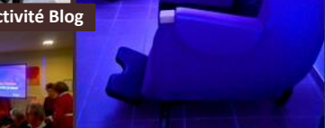
Karaoké - Activité Blog