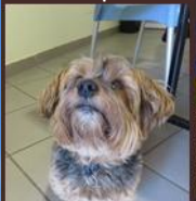
Diva, chienne d'une résidente