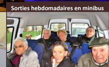
Sorties hebdomadaires en minibus