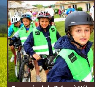
Traversée de la Drôme à Vélo