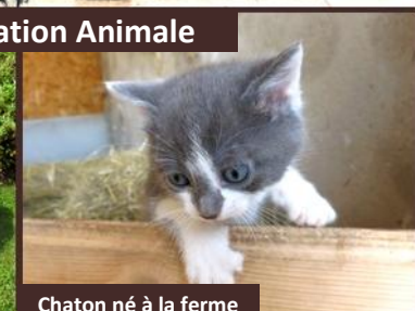
Chaton né à la ferme

Poneys, chiens et chats, poissons, poules et coqs, la médiation animale est une notion importante aux Monts du Matin. Les animaux de compagnie de nos résidents sont également les bienvenues.