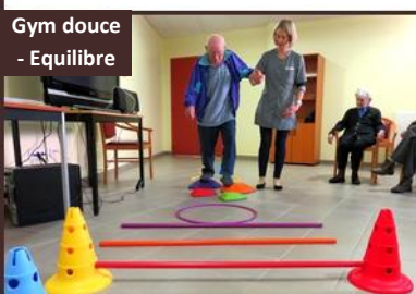
Gym douce - Equilibre

En gériatrie, la Psychomotricité permet de stimuler les fonctions motrices et corporelles qui ont un lien avec les fonctions cérébrales (Equilibre, Coordination, Mémoire, ...). Ces activités ralentissent les effets du vieillissement et les symptômes des maladies neurodégénératives de type maladie d'Alzheimer, et apportent du bien-être et du confort, à nos résidents.