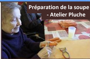
Préparation de la soupe - Atelier Pluche