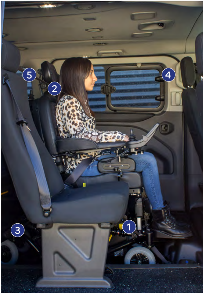
Figure 2 : installation passager (rang 2)