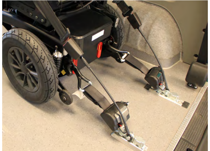
Figure 3 : arrimage par sangles (vue arrière)