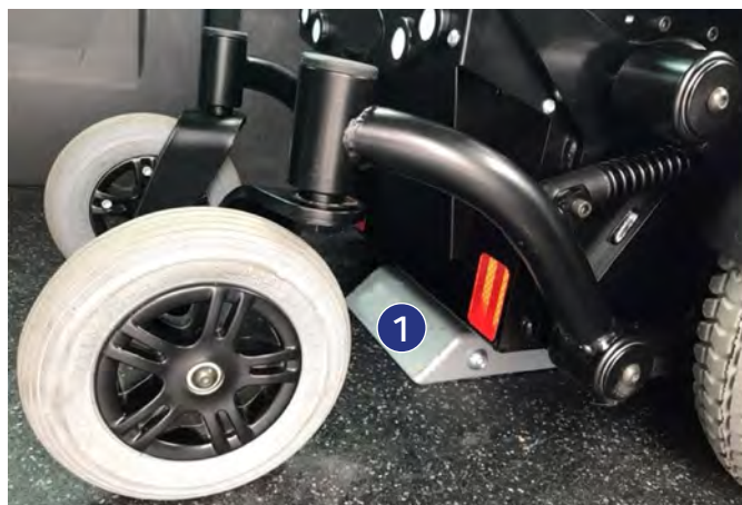
Figure 7 : ancrage automatique