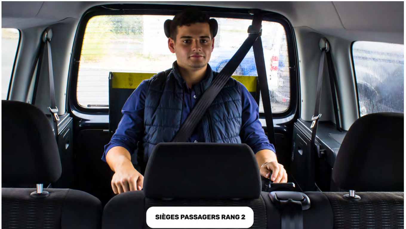
Figure 5 : installation en arrière de véhicule ; derrière les passagers (rang 3)