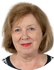
Catherine Deroche Sénatrice (LR) de Maine-et-Loire Présidente