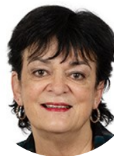
Michelle Meunier Sénatrice (SER) de la Loire-Atlantique Rapporteuse

Consulter le rapport d'information : http://www.senat.fr/notice-rapport/2020/r20-866-notice.html